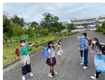
【下校時避難訓練】 万一の時はここに避難！