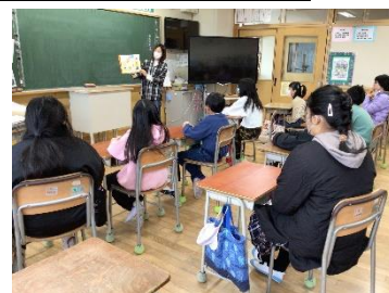
【読み聞かせの様子】