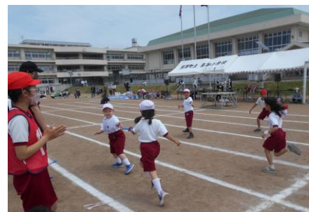
【令和4年度たてわりリンピックより】