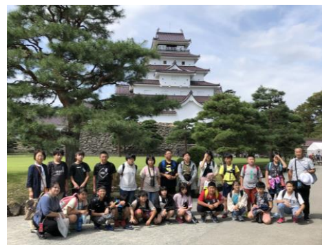
【令和4年度修学旅行より】